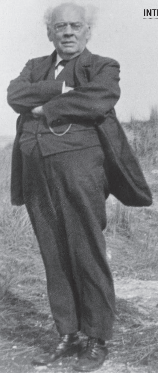
ARCHIEF JURRIAAN RÖNTGEN

Mark: 'Ik speelde onlangs nog in Arkansas Beethoven sonate opus 109, dan Röntgen Variaties en fuga op een thema van J.P.E.